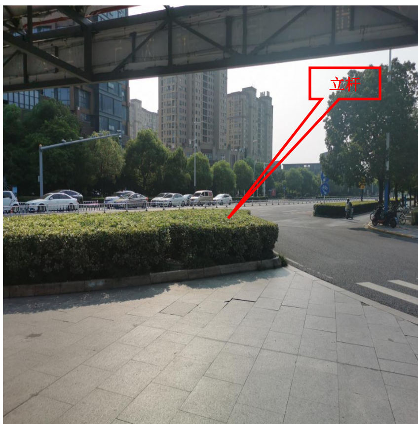
图 1-1 监控杆位置