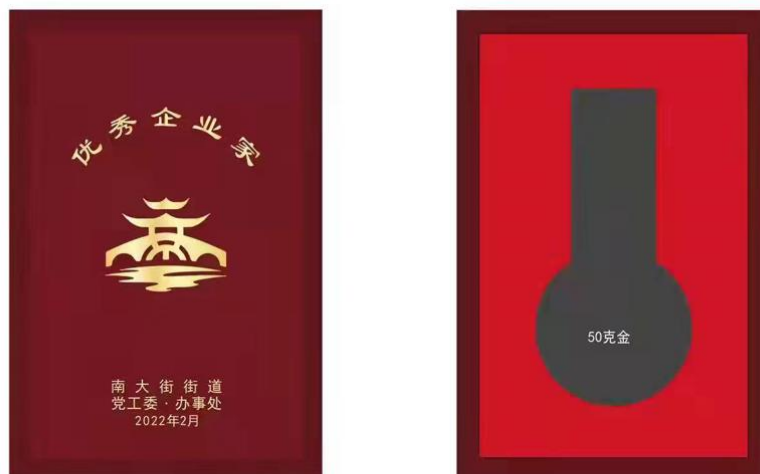
尺寸：140X200mm 仿红木色木盒，盒面上印金色 枣红色天地盖纸盒不烫字色