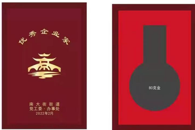
尺寸：140X200mm 仿红木色木盒，盒面上印金色 枣红色天地盖纸盒不烫字色