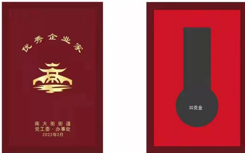
尺寸：100X150mm 仿红木色木盒，盒面上印金色 枣红色天地盖纸盒不烫字