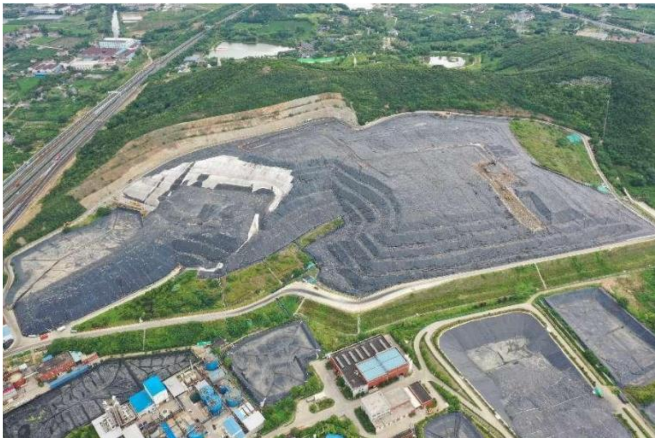
图 1.3 现场照片（2022 年 8 月）