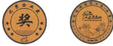
直径: 30mm 材质: 纯金10克