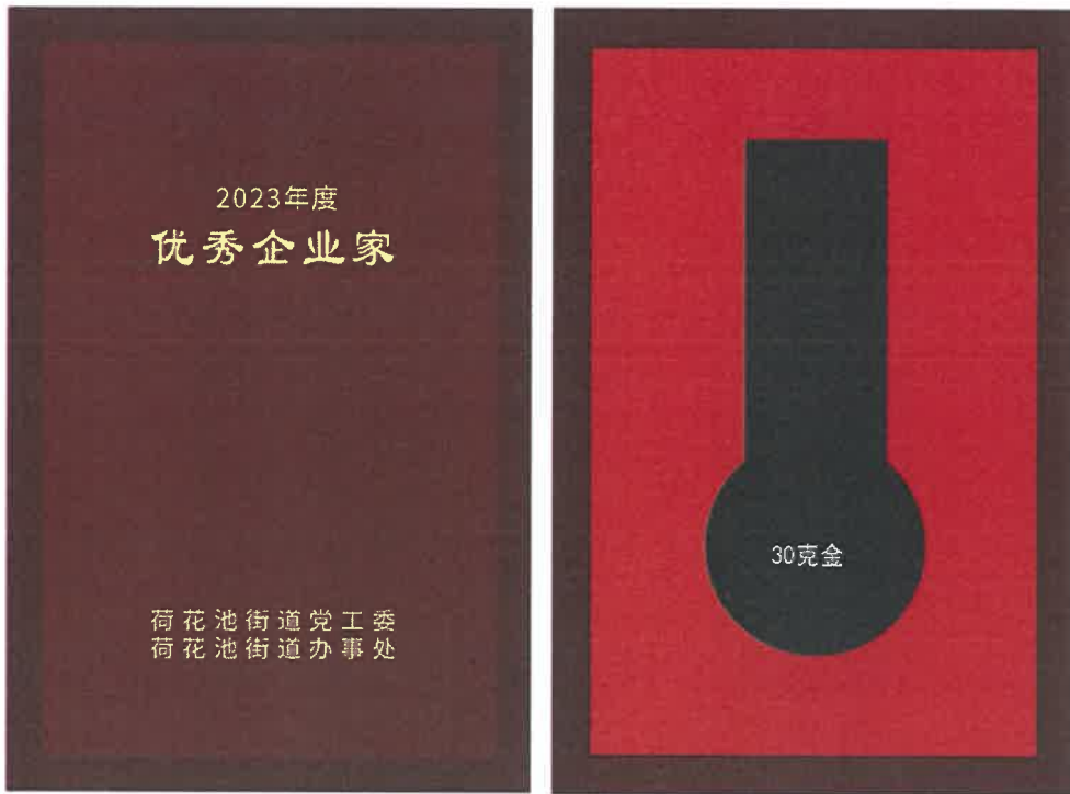
尺寸：100X150mm 仿红木色木盒，盒面上印金色 枣红色天地盖纸盒不烫字