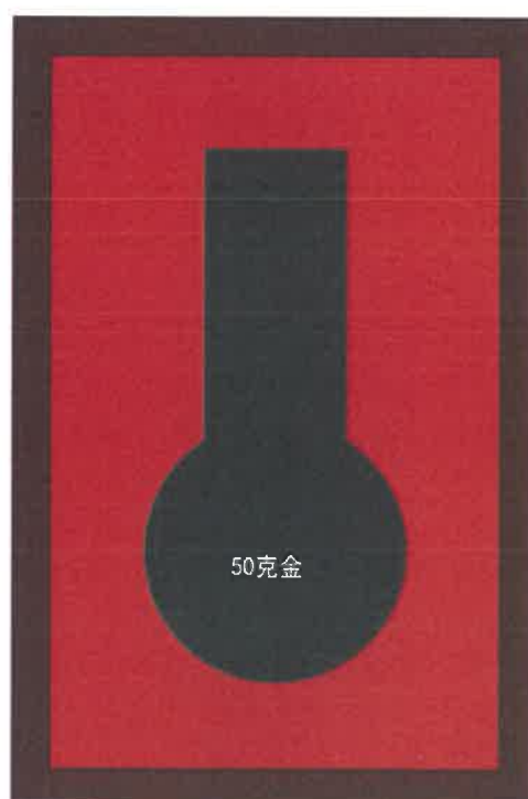
尺寸: 140X200mm 仿红木色木盒, 盒面上印金色 枣红色天地盖纸盒不烫字色