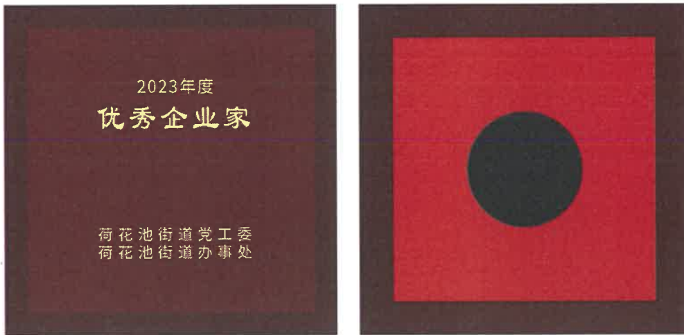
尺寸: 100X100mm 仿红木色木盒, 盒面上印金色 枣红色天地盖纸盒不烫字