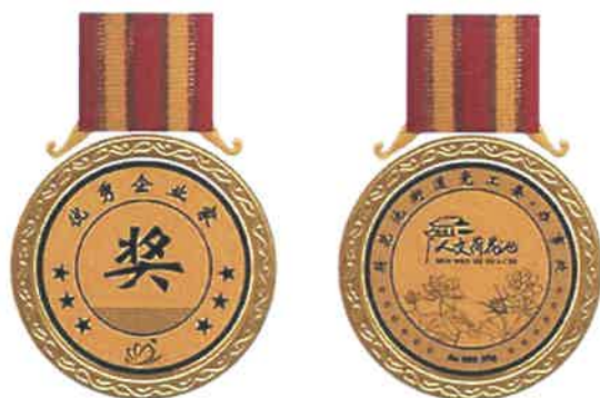
直径: 40mm 材质: 纯金50克