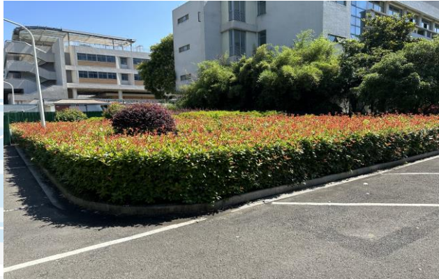
5、局部绿化清除，铺设草皮，约 530m 2 ，详见清单；