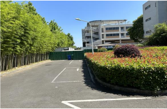
4、西北角绿化清除，改建沥青路面停车场，约 600m 2 ，详见清单；